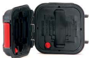
*Memory card case