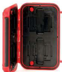
*Memory card case